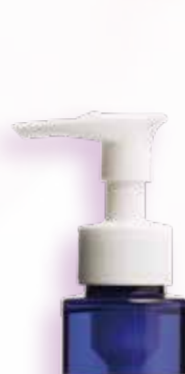
クレンジングオイル 3,000円（税抜）

日中、紫外線対策をしっかりと施したお肌…夜にはメイクや皮脂汚れだけではなく、花粉やちり、ほこり等の刺激物がたくさん付着しています。肌荒れ予防のためにも、1日の汚れはその日のうちにしっかりと落としましょう。刺激物の影響でお肌が敏感になりやすいので、クレンジングはいつも以上に“やさしく丁寧に”を心がけて。たっぷりのオイルをお顔にのせ、お顔を擦らないことを意識して行いましょう。その後のティッシュオフも、お顔を擦らないように、お顔にのせたティッシュをやさしく押さえ、ゆっくりと染み込ませるようにオフします。ワイエスラボのクレンジングオイルは、全成分がオリーブ由来のスクワランのみなので、メイクをしていない方も、クレンジングオイルをお使いいただくことで乾燥対策になります。ゆらぎやすいお肌にも、お肌にやさしいクレンジングオイルをお役立てください。