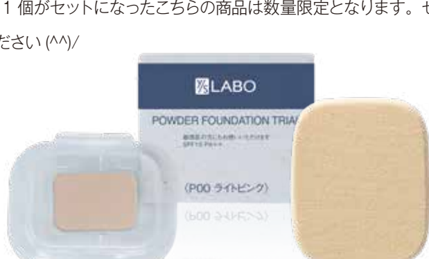
限定ファンデーショントライアルセット 600円（税抜特別価格）

お試しサイズのファンデーション（ライトピンク）1.2gと本商品のふわふわパフ1個がセットになったこちらの商品は数量限定となります。ぜひお試しください(^o^)/