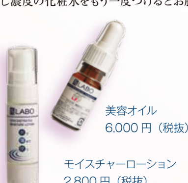
美容オイル 6,000円（税抜）

フラワー配合美容オイル ：手のひらに残った化粧水の水滴と美容オイルを混ぜ合わせ、お顔に馴染ませてください。水分とオイルが混ざることによって、皮脂膜と同じような状態になり、保湿効果が高まります。乾燥が気になる時は使用量を1滴～数滴増やしてみてください。気になる部分に重ね付けをするのもおすすめです。