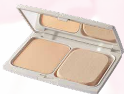
パウダーファンデーション ライトピンク (リフィル) 4,000円（税抜） ※コンパクトとパフは別売りです。

明るさも、これまで一番明るいお色でした『ライト』よりもさらに明るい仕上がりです。色白肌の方のファンデーションとしてはもちろんですが、Tゾーンや目元などにプラスすることで陰影がつき、立体感の演出にもお役立ていただけます！